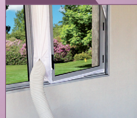
Kit fenêtre à ventail en option